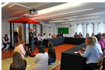
茶道実演イメージ